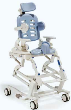
Châssis de transfert et de soins