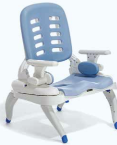
Châssis pour baignoire